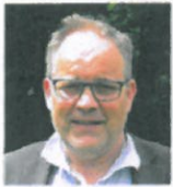
Tekst: Elof Westergaard, biskop i Ribe stift.